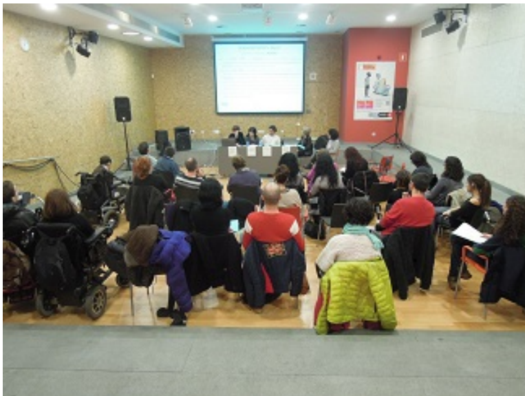
Imatge 1: La taula rodona al Casal de Joves Palau Alós.