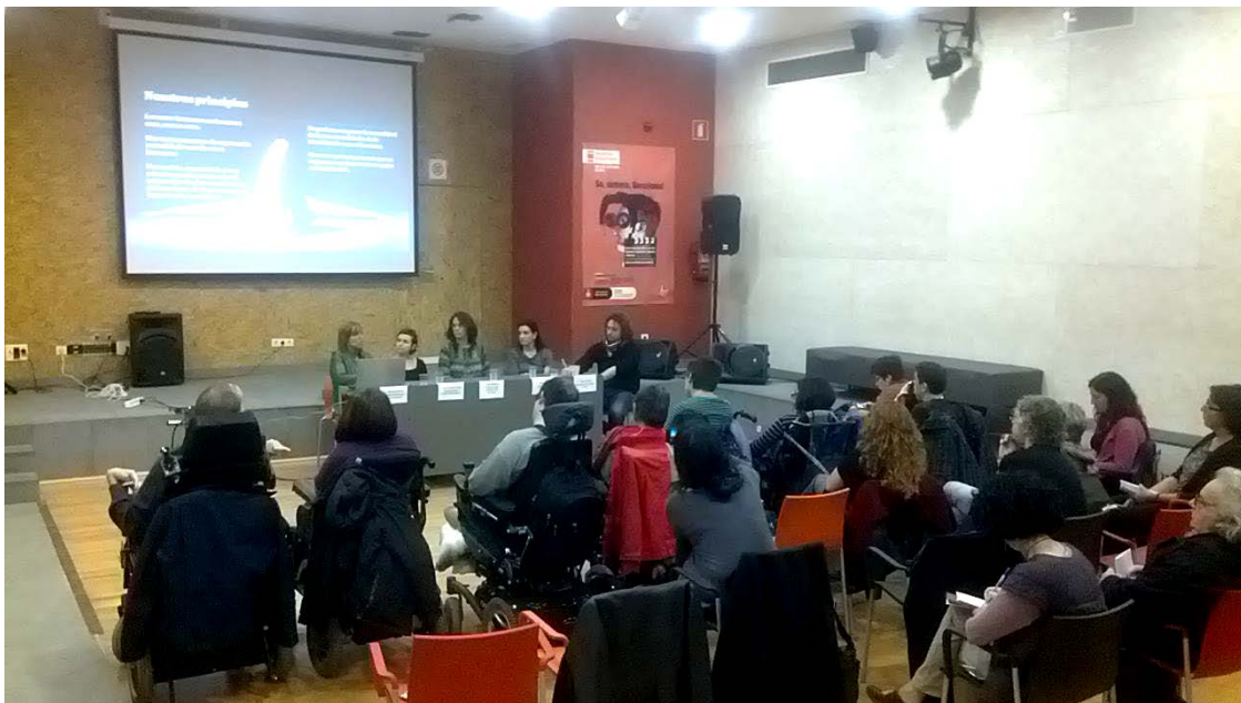
Imatge 1: La taula rodona al Casal de Joves Palau Alós.